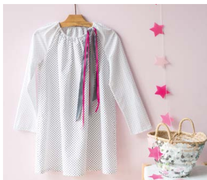
Modèle n°19 Robe d'été.....124