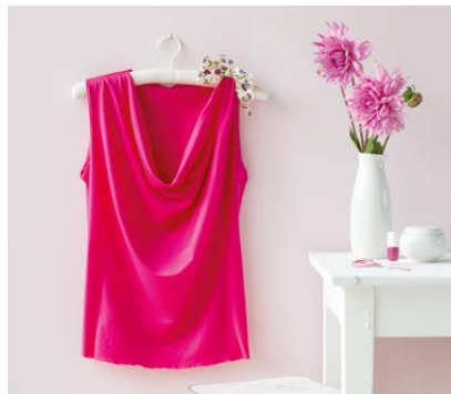
Modèle n°14 Tee-shirt à col..... 88