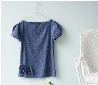
Modèle n°10 Chemise cintrée manches ballon..... 66