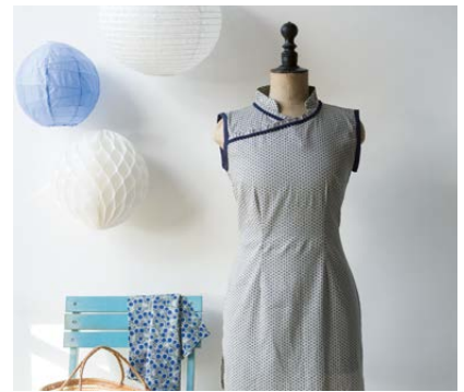
Modèle n°27 Robe chinoise.....167