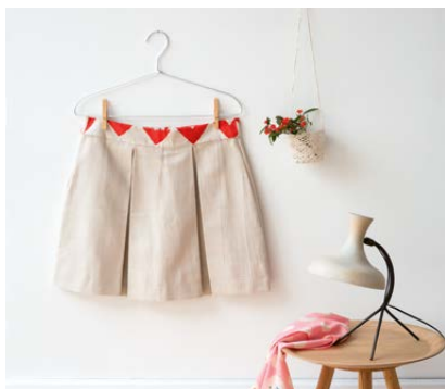
Modèle n°28 Jupe plis creux.....174