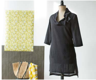
Modèle n°23 Robe noire.....145