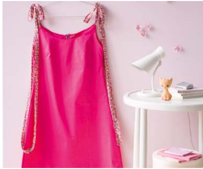
Modèle n°22 Robe rose.....140