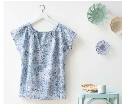
Modèle n°12 Chemise bleue à petits plis..... 78