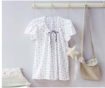
Modèle n°8 Tunique légère..... 54