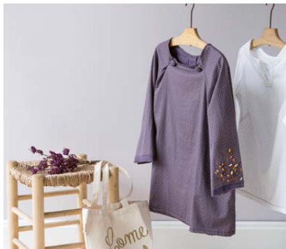
Modèle n°13 Tunique manches raglan à gros plis..... 82