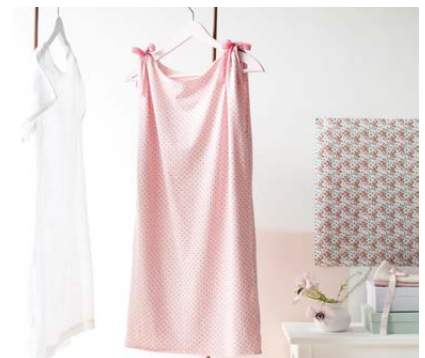
Modèle n°30 Robe tee-shirt.....186