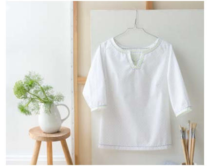
Modèle n°9 Tunique brodée..... 60