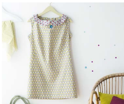
Modèle n°17 Robe cintrée à col.....114