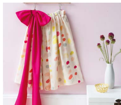
Modèle n°21 Jupe pour aller danser.....134