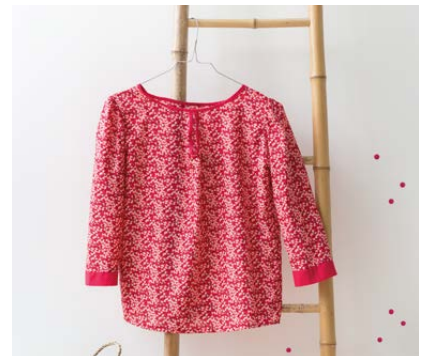
Modèle n°15 Tunique rouge..... 94