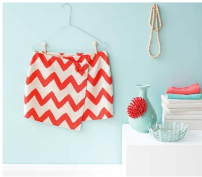
Modèle n°25 Jupette croisée.....157