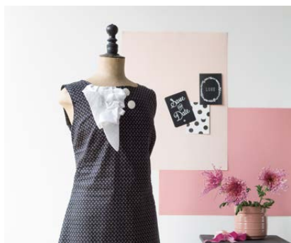
Modèle n°16 Robe cintrée noire à jabot.....108