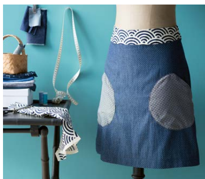
Modèle n°20 Jupe pop.....128