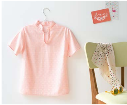
Modèle n°7 Chemise col Mao..... 48