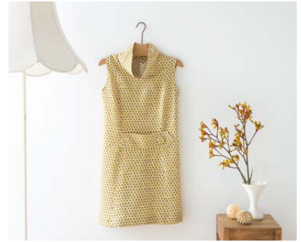
Modèle n°24 Robe années 50.....151