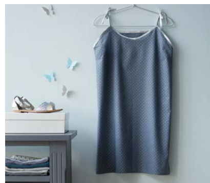
Modèle n°18 Liquette.....120