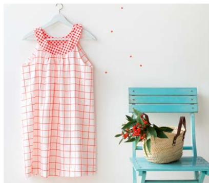
Modèle n°29 Robe encolure ronde.....180