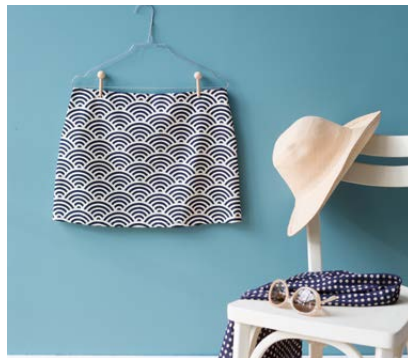
Modèle n°26 Jupette.....163