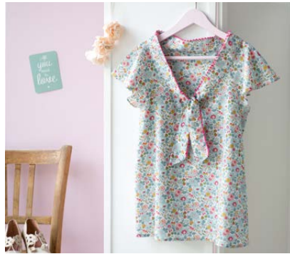
Modèle n°11 Chemise années 1950..... 72