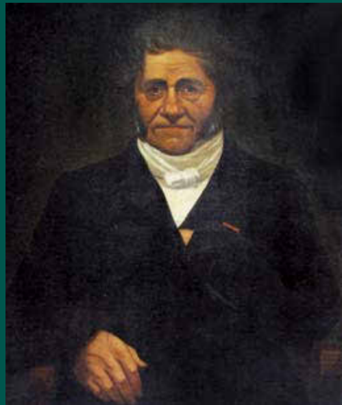
Nicolas Surcouf, l'un des frères de Robert Surcouf. Huile sur toile anonyme.

Né en 1770, Nicolas Surcouf commence sa carrière à 15 ans : d'abord quatre voyages à Saint-Pierre-et-Miquelon, puis trois à Saint-Domingue. Son passage dans la flotte de la République se termine par son emprisonnement en Angleterre de 1796 à 1798. Libéré, il est second de son frère Robert sur la Clarisse . Capturé sur l' Adèle , il est libéré une nouvelle fois. Après avoir commandé la Caroline de 1804 à 1806, il s'installe à la Giclais et devient armateur et propriétaire de plusieurs exploitations agricoles. Il décède en 1848 et sera inhumé à côté de son frère Robert.