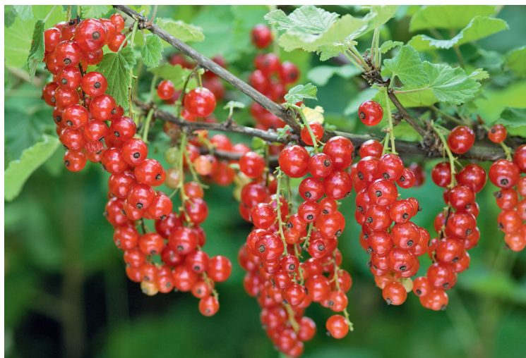
▲ Groseille 'Laxton'.

Remplissez votre potée du terreau adéquat, creusez un trou au centre. Retirez le pot en plastique de votre plante puis, à l'aide d'une griffe, grattez les racines de la motte pour les aérer et les aider à bien s'installer. Placez votre végétal dans le trou. Le dessus de la motte doit effleurer la surface du substrat. Ajustez en conséquence en rajoutant ou retirant du terreau sous la motte. Une fois la plante bien en place, comblez les espaces vides sur les côtés avec du terreau. Tassez fortement. Arrosez.