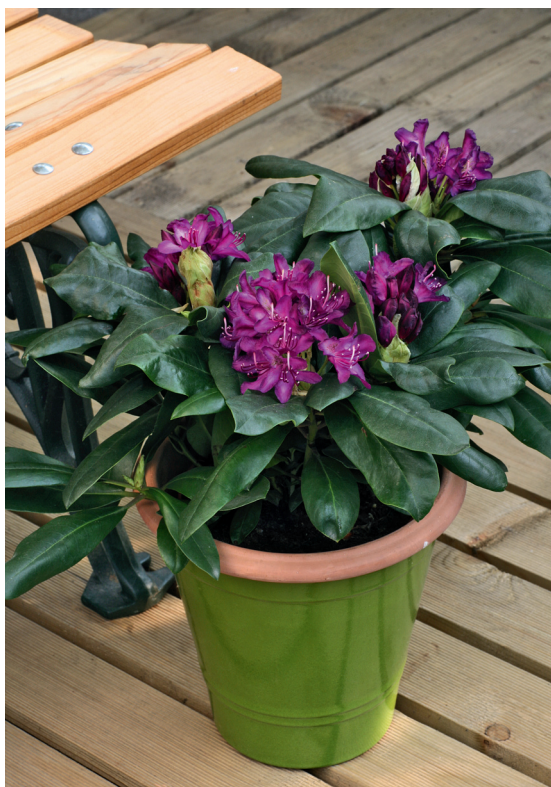
▲ Acide ou calcaire ?

C'est le potentiel hydrogène. Le pH permet de définir l'acidité du sol et est compris entre 0 et 14. Vous pouvez voir la mesure sur l'arrière des sacs de terreau, c'est écrit sur l'emballage. La moyenne est à 7. En dessous de 7, le terreau est acide ; au-dessus de 7, il devient plutôt calcaire. La majorité des terreaux se situant entre 6,5 et 7,5, on peut considérer qu'ils sont neutres. Pour le balcon, hormis pour les plantes de terre de bruyère qui ont besoin d'un terreau relativement acide (pH d'environ 5) et pour lesquelles vous utiliserez de la terre de bruyère, pour tout le reste, vous n'avez pas à vous soucier de ce fameux pH !