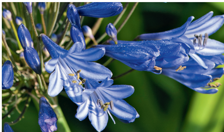
▲ Agapanthe 'Storm cloud'.