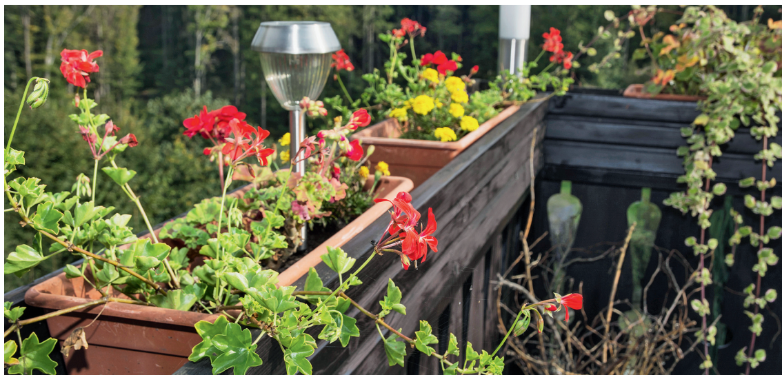
▲ Le géranium, une plante de plein soleil.

Trouvez une feuille assez grande, commencez par tracer les limites de votre balcon à l'échelle pour ne pas avoir de mauvaises surprises ensuite.