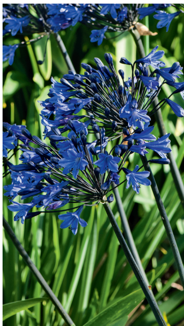
▲ Agapanthe 'Black is black'.

Dans les régions aux hivers rigoureux, dès octobre, rentrez votre plante au frais, entre 5 et 8 °C, dans un endroit assez lumineux et sans courants d'air,