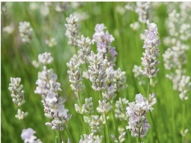
▲ Lavande 'Little Lotties'.