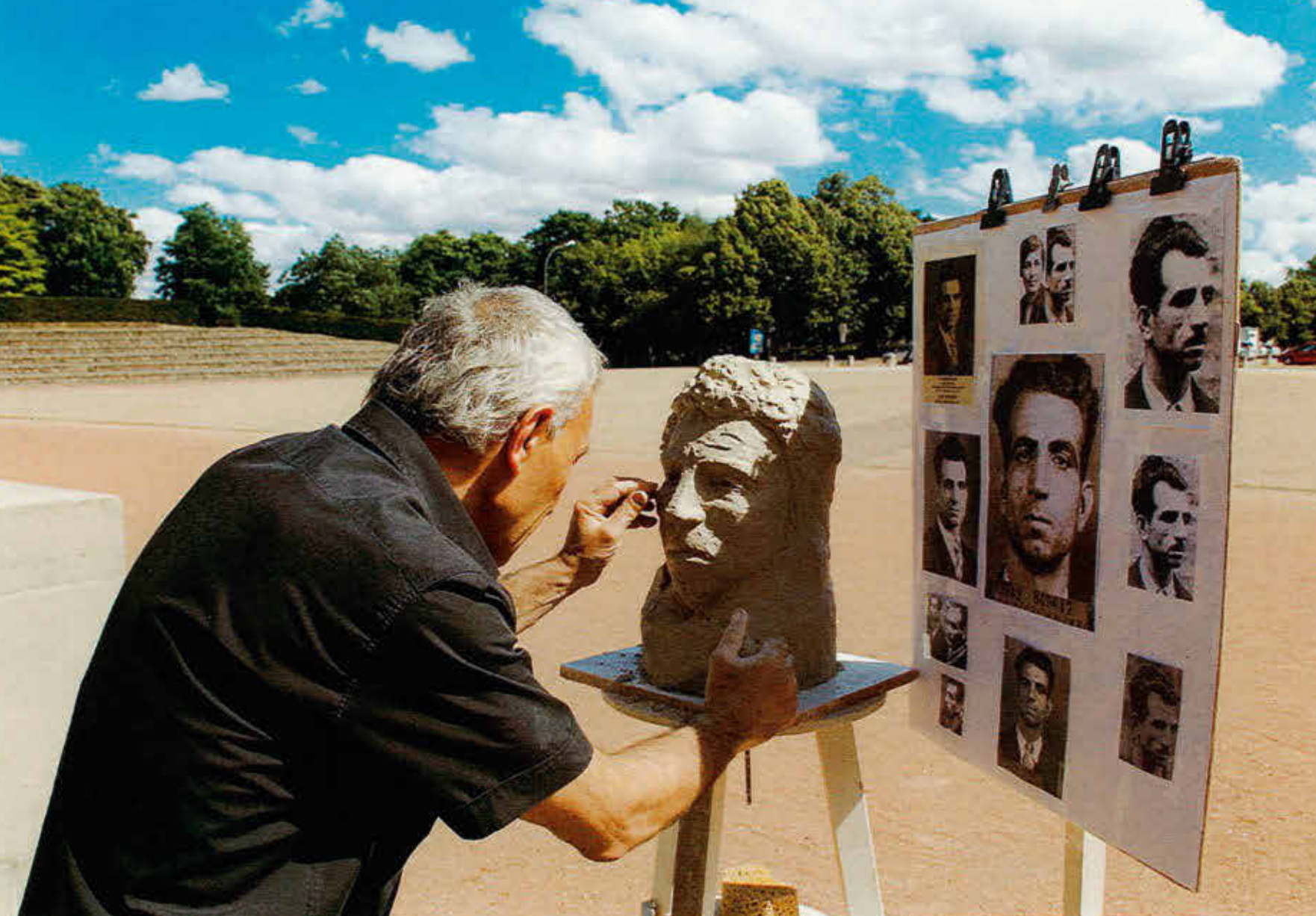
Arestakes pendant la réalisation en direct, et sans exercice d'exécution préalable, du buste de Missak Manouchian. Esplanade du Mont-Valérien, 9 juin 2017

corps et ses différentes postures. C'est là qu'il découvre pour la première fois la terre glaise. L'autodidacte avait maîtrisé la sculpture à main levée avant le modelage.