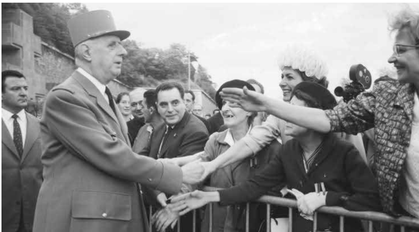
Charles de Gaulle saluant le public sur l'esplanade du Mont-Valérien lors de la 22 e commémoration de l'Appel du 18 juin 1940, 1962

Dès les derniers mois de la Première Guerre mondiale, de Gaulle analyse ce qu'il a vécu dans les tranchées de Mesnil-les-Hurlus ou de Douaumont. Il se montre de plus en plus critique envers le haut-commandement et de plus en plus sensible au sort de ses « milliers de camarades restés sur le carreau » 3 . Une fois la paix revenue, il conçoit la mémoire non pas comme un geste tourné vers un passé révolu, mais comme un engagement contractuel avec l'avenir. C'est ce qu'il déclare à ses hommes du 19 e Bataillon de chasseurs à pied, à Trèves, lors d'une cérémonie devant le monument aux morts du régiment, en 1929 : « Ce n'est point seulement pour célébrer des morts glorieux que nous nous trouvons rassemblés. Des épreuves de la mort, la vie sort victorieuse, ainsi, des actes du passé, nous