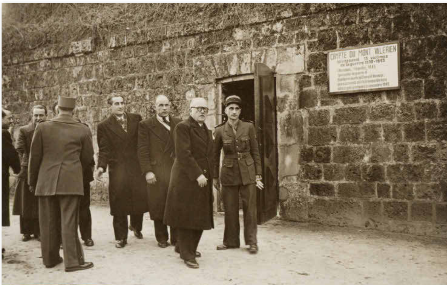
Vincent Auriol à la crypte provisoire, 16 janvier 1947

Érigé comme le premier Haut lieu de la mémoire nationale par le général de Gaulle en 1960 1 , la vie du Mont-Valérien est rythmée chaque année par plusieurs temps commémoratifs dont la cérémonie du 18 juin inscrite dans le calendrier des commémorations nationales. Depuis le 18 juin 1960, le chef de l'État a toujours participé à cette tradition commémorative, sauf à de très rares exceptions où les premiers ministres ont présidé ces cérémonies.