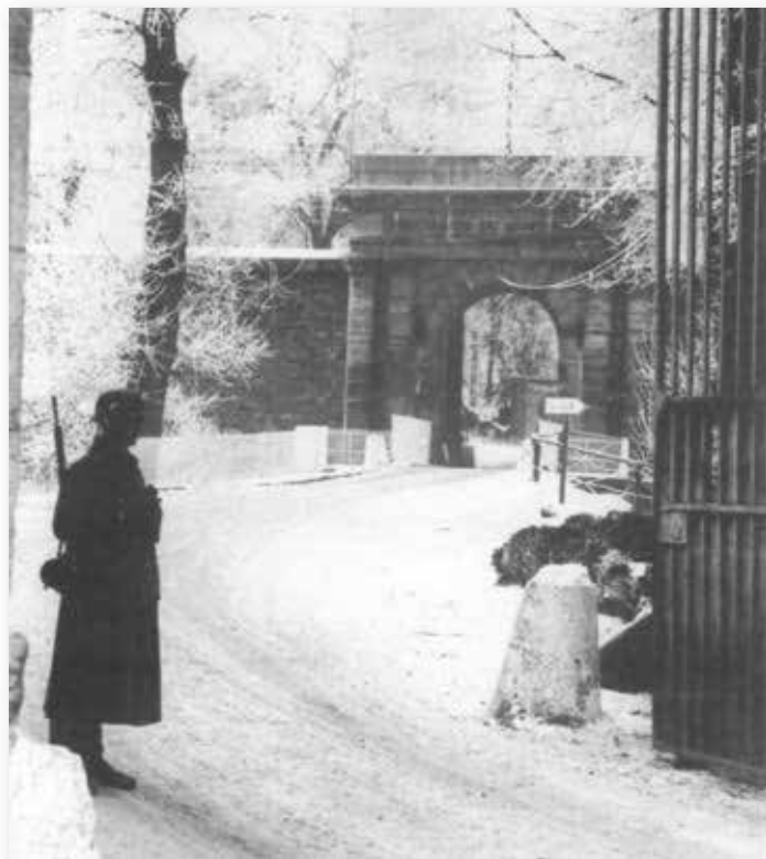
Sentinelle allemande à l’entrée de la forteresse militaire du Mont-Valérien, pendant l’Occupation, cliché non daté avec précision

En 1940, l’essentiel de l’appareil répressif mis en place par l’administration allemande repose sur ses tribunaux militaires, c’est-à-dire sur une politique judiciaire à visage légal relevant du droit pénal et militaire. Les impératifs stratégiques prennent le pas sur toute autre considération et la vision centrale du franc-tireur tend à criminaliser tout acte d’un civil contre l’occupant. Mais, à la différence de ce qui se déroule à l’Est, un cadre juridique demeure, dans lequel l’adversaire patriote, tout en étant sévèrement condamné, peut être jugé « digne de respect ». C’est le cas lors du procès du groupe d’Honoré d’Estienne d’Orves qui se tient à Paris en mai 1941 :