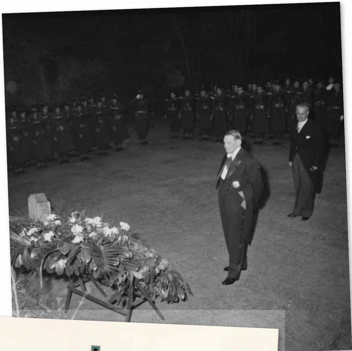
René Coty, à la clairière, rend hommage aux fusillés, avril 1954