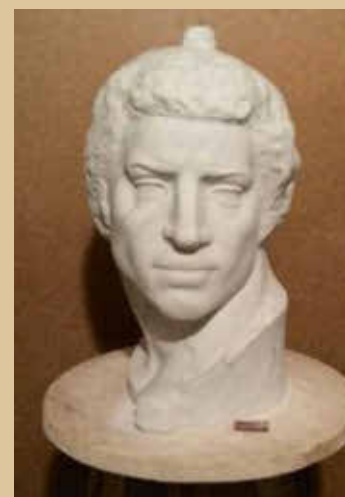
Reproduction à l'identique du Brutus de Michel-Ange par Arestakes pour le titre de Meilleur Ouvrier de France, 2015

et de la justesse du portrait. Sculpteur confirmé, il complète ses connaissances sur l'anatomie aux cours du soir des Ateliers Beaux-Arts de Paris où il réussit à entrer afin d'aborder le nu, de maîtriser la représentation du