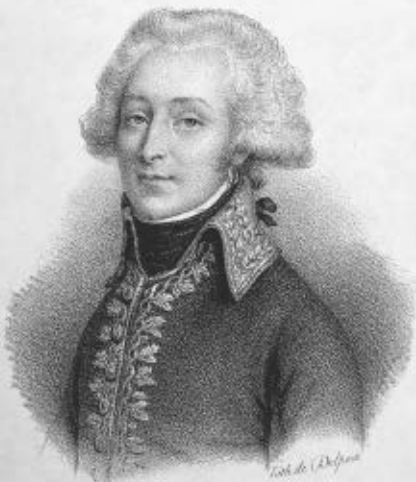
Alexandre François, vicomte de Beauharnais, premier époux de l'impératrice Joséphine. Il sera guillotiné le 23 juillet 1794.

quitterez votre actuel amour pour un autre, et encore un autre. Je vois un banquier, vous aurez une ribambelle d'enfants et finirez votre vie dans un château.