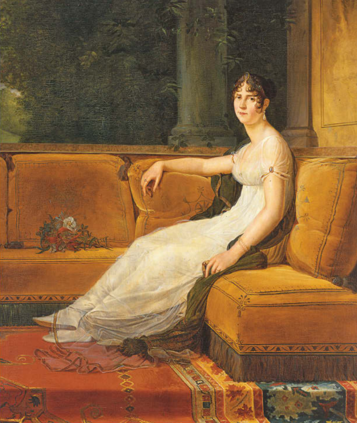
L'impératrice Joséphine, consultante privilégiée et amie de Mlle Lenormand.