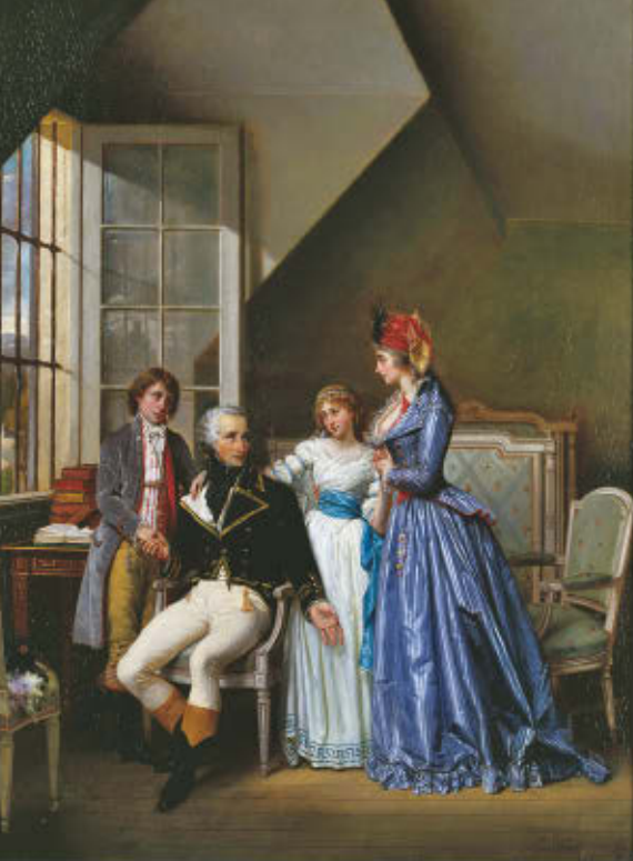
Joséphine de Beauharnais rendant visite à son époux Alexandre en prison.