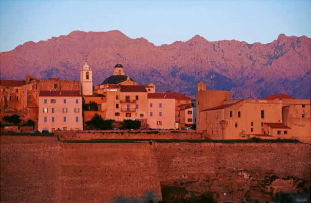
Citadelle de Calvi, la chaîne du Monte Cinto, au second plan.