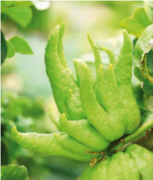
Cédrat ou main de Bouddha.