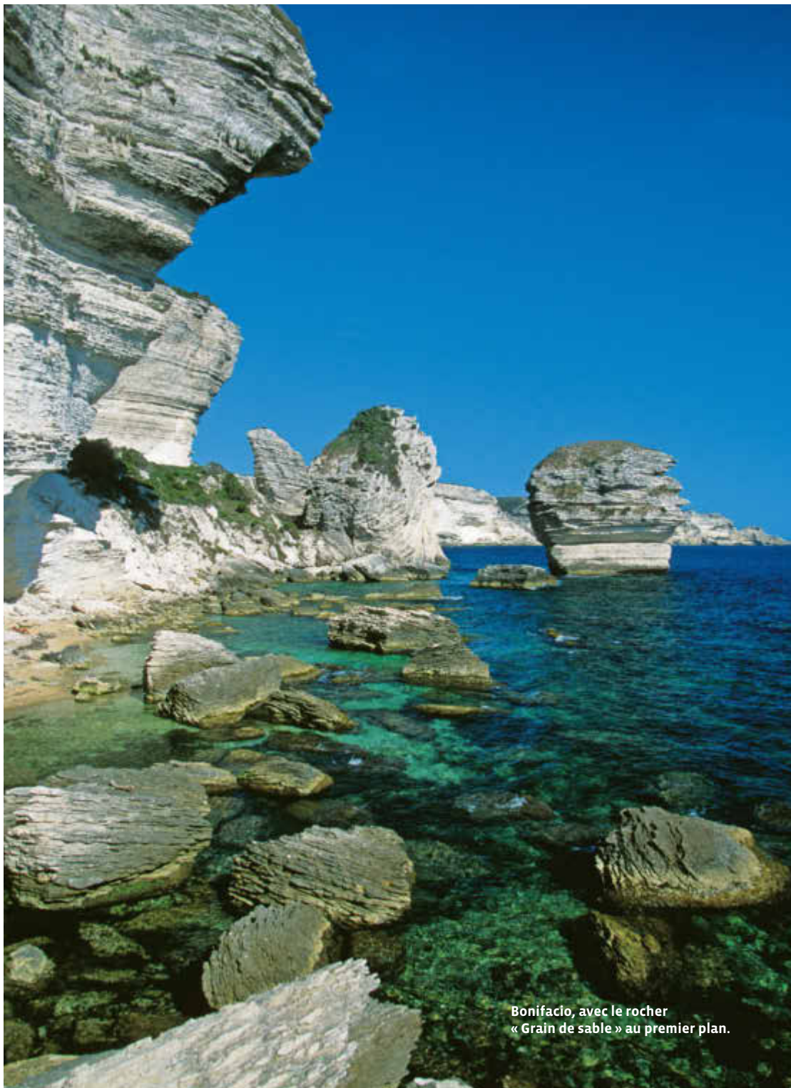
Bonifacio, avec le rocher « Grain de sable » au premier plan.