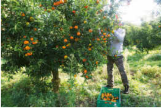
Récolte de la clémentine corse (IGP).