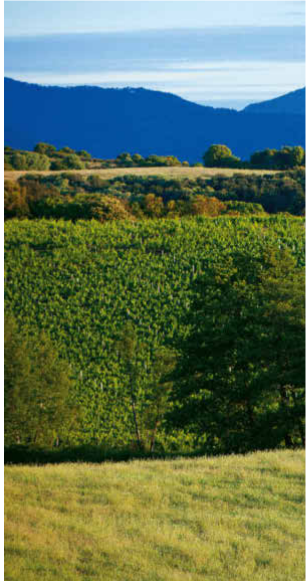
Vignes et arbres fruitiers, vers l'étang d'Urbino.