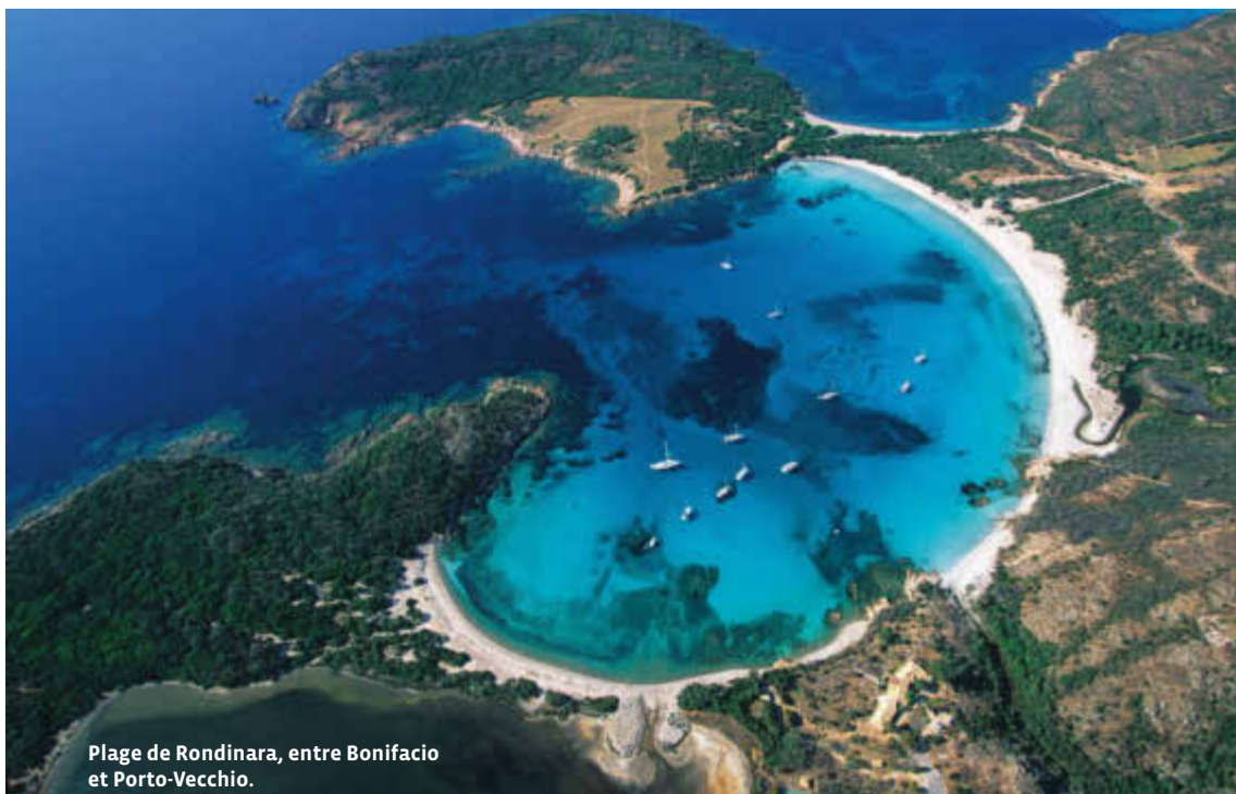
Plage de Rondinara, entre Bonifacio et Porto-Vecchio.

épine dorsale montagneuse de l'île, dont les aiguilles de Bavella, l'un des sites naturels les plus célèbres du sud. Là, dans cette nature généreuse, presque tous les villages sont traversés par des sentiers de randonnée. Un très bel itinéraire qui varie les ambiances.