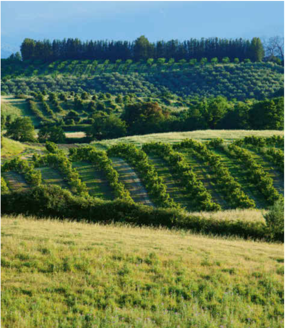
Arbres fruitiers, champs d'oliviers en arrière plan, vers Ghisonaccia.