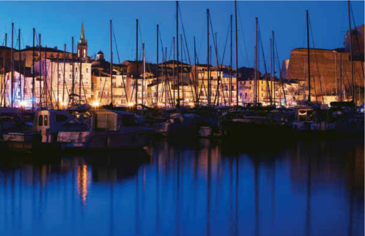
Port et citadelle de Calvi.