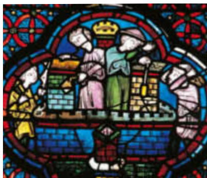
PAGE DE GAUCHE ATTAQUE D'UN CHÂTEAU FORT.

qu'il soit séculier ou religieux, peut donner l'autorisation de fortifier une place, une ville ou une région. Cette prérogative confère le droit de ban qui recouvre l'exercice de la justice, l'entretien d'hommes en armes et la perception d'impôts et de péages. Au XI e siècle, profitant d'un affaiblissement du pouvoir royal ou comtal, de nouveaux seigneurs se taillent des territoires, s'accaparent des châteaux et multiplient la construction sans autorisation de nouvelles places fortes.