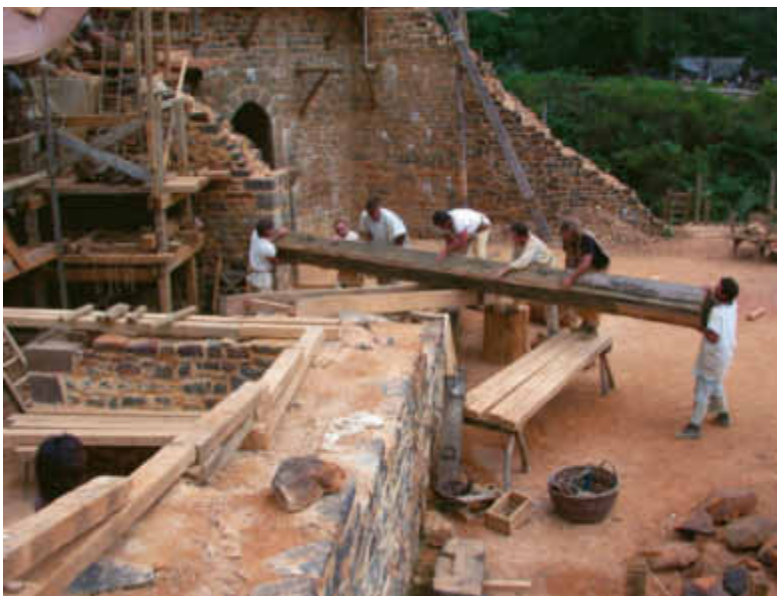
CI-DESSUS LE SOMMIER EST HISSÉ SUR UNE RAMPE EN BOIS.

Sur les murs en « escalier », nous disposons des rails de bois qui vont former une rampe. Il nous suffit de poser les poutres sur les rails et de les faire basculer par quartier jusqu'au sommet du mur. Les six poutres sont mises en attente et les maçons peuvent reprendre les maçonneries pour araser l'ensemble des murs et faire disparaître l'escalier artificiel. Quelques semaines plus tard, chacun des sommiers sera redistribué sur toute la longueur du logis et chacun prendra place sur son corbeau respectif.