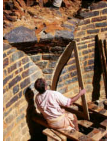
UN MAÇON VÉRIFIE LA COURBURE DE L'ARÊTE À L'AIDE D'UN GABARIT.