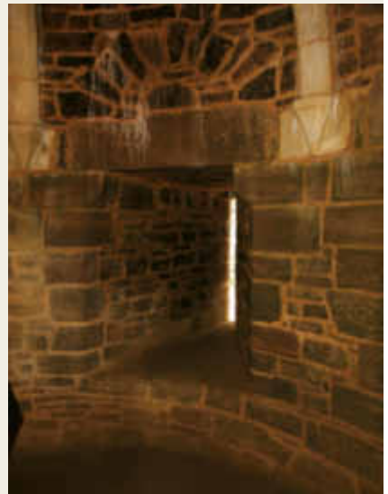
GUÉDELON : ARCHÈRE À ÉBRASEMENT SIMPLE.

Les archères Plantagenêt : le modèle Plantagenêt est inscrit dans une niche murale percée dans l'épaisseur du mur qui permet à l'archer de s'approcher au plus près de l'ouverture de tir. Elle est munie d'un reposoir pour le pied apportant plus de commodité pour le tir à l'arc ou à l'arbalète. Sur certains châteaux, les