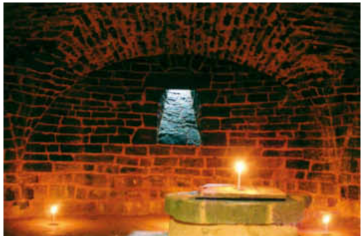
LA VOÛTE D'ARÊTES EST TERMINÉE.

mortiers sont encore frais afin qu'il forme avec les pierres une masse homogène. Lors du décoffrage de cette voûte d'arêtes, nous avons entendu le bruit de petites boulettes de mortier tombant sur les couchis de bois et senti physiquement les 100 tonnes de maçonnerie se mettre en charge ! Comme au Moyen Âge, les voûtes sont devenues à Guédelon une expression architecturale évidente.