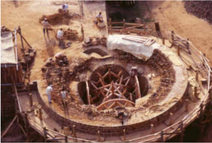
LES CHARPENTIERS ASSEMBLENT LE COFFRAGE QUI SOUTIENDRA LES MAÇONNERIES DURANT LA CONSTRUCTION DE LA VOÛTE.