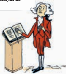
CM1 - À la rencontre des chrétiens 5

Le jour de leur investiture, les présidents américains prêtent serment sur la Bible, comme l'a fait George Washington, le premier président des États-Unis, il y a deux siècles. Chaque président suit la tradition à sa façon en choisissant sa bible personnelle ou une bible ayant appartenu à une personne célèbre comme celle de Martin Luther King.