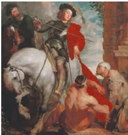
↑ Saint Martin partageant son manteau, Anthonis Van Dyck, XVII e siècle.

une terrible bataille, le commandant sonne la retraite. Mais Desmond reste seul et va chercher les blessés sous la mitraille au péril de sa vie. Il sauve 75 soldats en les descendant un à un d'une falaise. Il devient un héros !