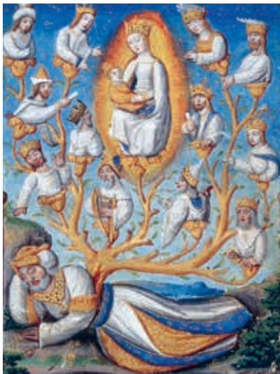
↑ Ecoen, L'arbre de Jessé, XVI e siècle.