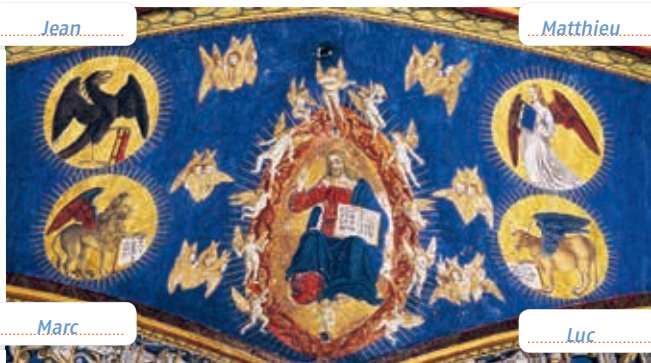
Albi, cathédrale Sainte-Cécile, XVI e siècle. Jésus entouré des 4 évangélistes représentés par leur symbole.