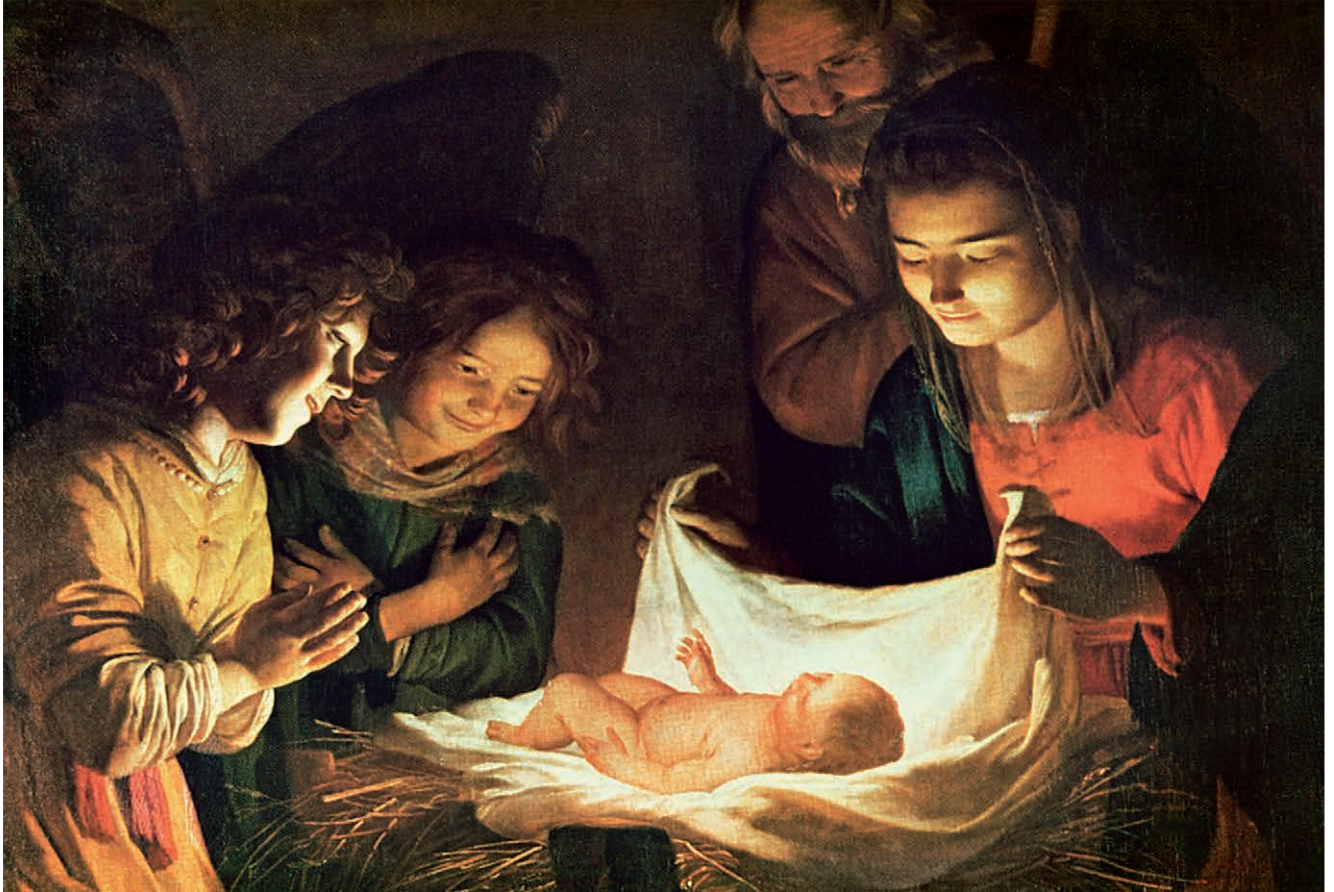
Nativité de Van Honthorst (xvii e siècle)

Ils se hâtèrent d’y aller et ils découvrirent Marie et Joseph, avec le nouveau-né couché dans la mangeoire. (Luc 2, 16)