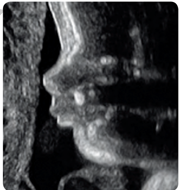
Profil, 7 mois-32 SA.

ses reins et son intestin fonctionnent. Ses poumons ne sont pas encore matures