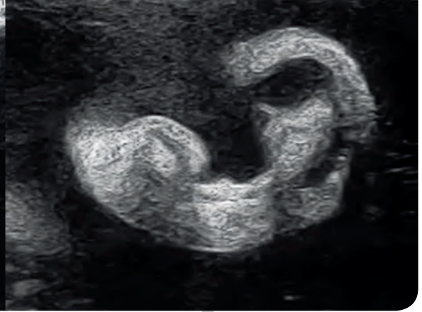
Oreille, 32 SA.

aux sources lumineuses habituelles. Une accélération du cœur du fœtus a été remarquée à l'allumage d'une lumière introduite in vitro lors d'une amnioscopie.