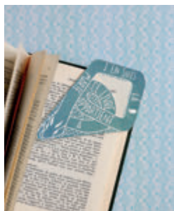
1. SERPENT MARQUE-PAGE p.14