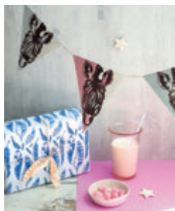
9. GUIRLANDE ZÉBRÉE p.41