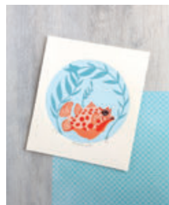
12. POISSON BULLE p.52