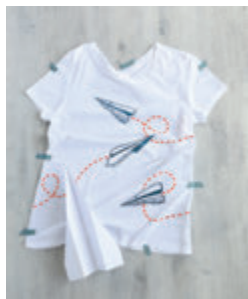
5. TEE-SHIRT DANS LE VENT p.26