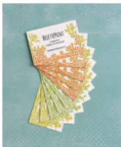
2. CARTES DE VISITE SUCCULENTES p.17