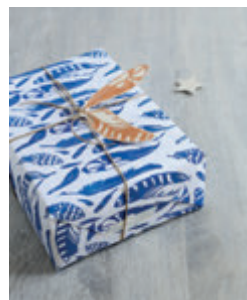
4. PAPIER CADEAU À PLUMES p.23