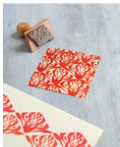
3. TAMPON ART DÉCO p.20