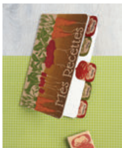
10. CARNET DU POTAGER p.44