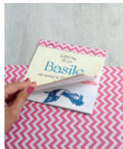
8. FLIP-BOOK CIGOGNE p.37