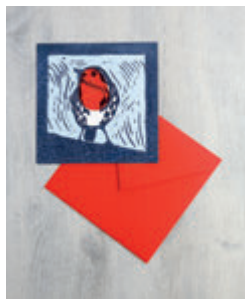
7. CARTE ROUGE-GORGE p.34