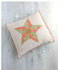
6. COUSSIN ÉTOILÉ p.30