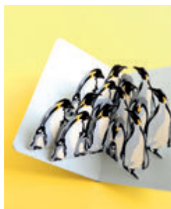
11. POP-UP MANCHOTS p.48