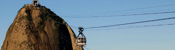
Le téléphérique et le Pain de Sucre. David Roger, architecte-urbaniste