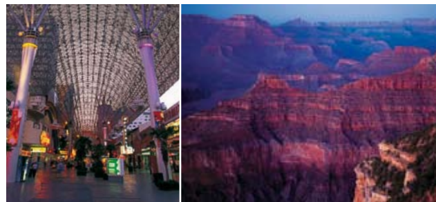
Gauche Fremont Street Experience Droite Grand Canyon