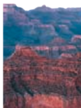
Gauche Grand Canyon