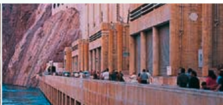
Droite Hoover Dam