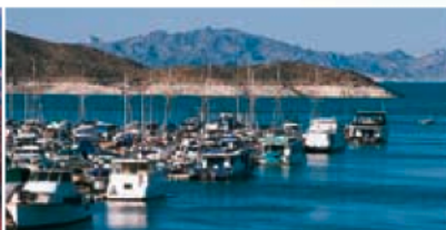
Centre gauche Marina du lake Mead