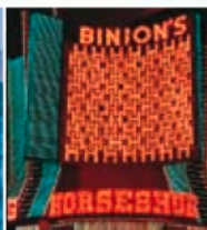
Centre droite Casino Binion's Horseshoe