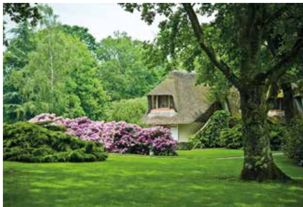
Les Bezards, 45290 Boismorand, + 33 (0)2 38 31 80 01