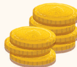
Moedas de Ouro