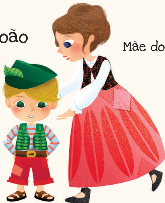
Mãe do João