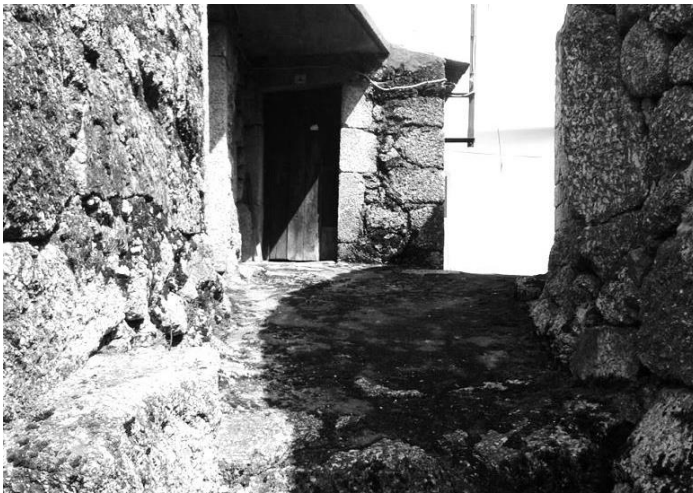
Figura 21 – Casas antigas de granito.

Quem, no Largo D. Dinis, optou por seguir para a direita, pôde apreciar as ruas estreitas que saem do Terreiro da Neta e uma paisagem fascinante, diferente de todas as outras, que se pode apreciar da Eirinha em direção aos terrenos verdejantes da Cal, da Mestra ou mesmo do Junqueiro e das Vinhas. Seguindo as ruas estreitas que existem ali naquelas imediações, é possível encontrar algumas casas antigas, numa linha muito diferente das que se encontram na Rua da Lapa. É outra forma de beleza. Circundando atrás das casas do Largo D. Dinis e completando o círculo, volta-se ao mesmo lugar.