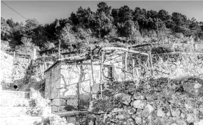
Figura 19 – Moinho situado no Bairro do Cimo, nos terrenos da Eira do Costa.

Quem, ao fazer a visita, se demorou pelo bairro do Cimo, pôde apreciar o aglomerado de casas de pedra, muito juntas, quase todas unidas umas às outras, algumas servidas por estreitíssimas ruas muito típicas. Uma das ruas do Bairro do Cimo é a Rua do Rego que ganhou esse nome, porque ali, outrora, seguia um rego de água a céu aberto, dividindo a rua em três partes quase iguais, sendo uma delas o próprio rego. Outra rua é a Rua da Lapa. Calçetada até há pouco tempo com o piso original, a Rua da Lapa é uma das mais interessantes de toda a aldeia. As suas casas, quase todas com a pedra à vista, estão encostadas ao morro de modo que, em certos casos, uma das paredes é a própria encosta. Por ali, há um ribeirão que corre, vindo dos terrenos das Tapadas e da Ladeira, e, na vertente da margem esquerda do ribeiro, há um moinho que já não é utilizado por não haver quem cultive cereais e há terrenos cultivados onde as hortas frescas embelezam a paisagem e a tornam ainda mais semelhante à Lapa dos primeiros tempos.