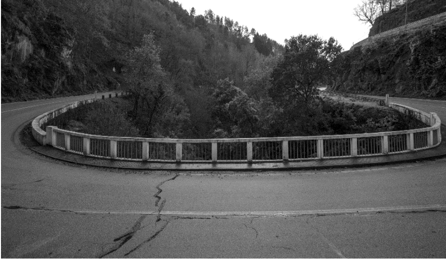
Figura 14 – As duas margens do Rio Alva, na Estrada N. 231, na Ponte Jugais.

ramos secos a estalar, escuta-se a limpidez da água que corre em riachos, por todo o lado, e o melodioso chilrear das aves que nidificam naqueles bosques densos e frescos. E, do outro lado da encosta, os terrenos verdejantes permitem o realce das flores cor-de-rosa dos pessegueiros e das cerejeiras vestidas de noiva.