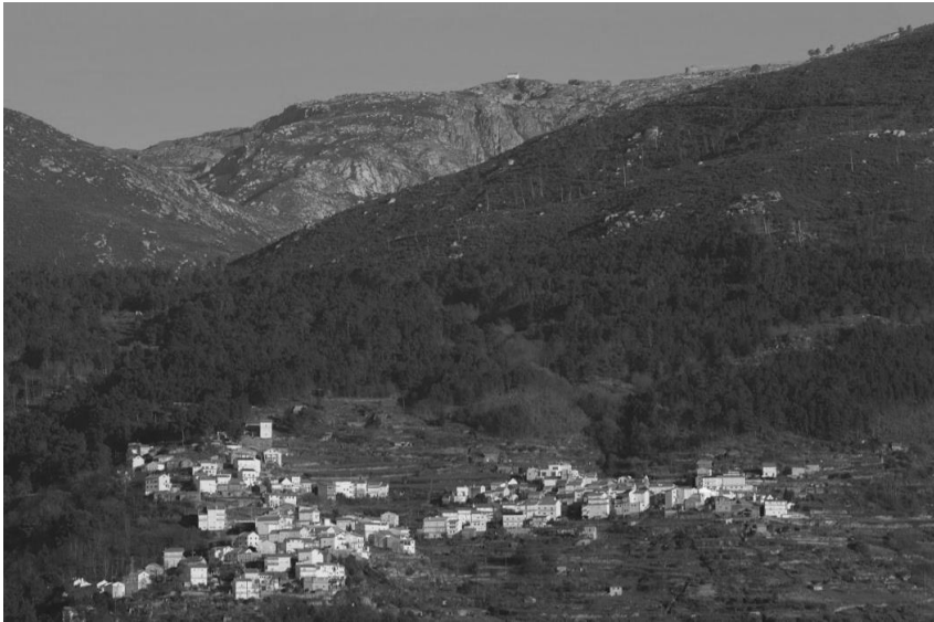
Figura 7 – Lapa dos Dinheiros e a Lagoa Comprida lá ao cimo.

bilitações, não conseguindo exercer a profissão que escolheram perto da aldeia onde nasceram, foram obrigados a partir para lugares onde pudessem exercer as suas profissões e por lá fixaram as suas vidas, se bem que levaram a Lapa dos Dinheiros no coração e alimentam a saudade quando vêm de visita.