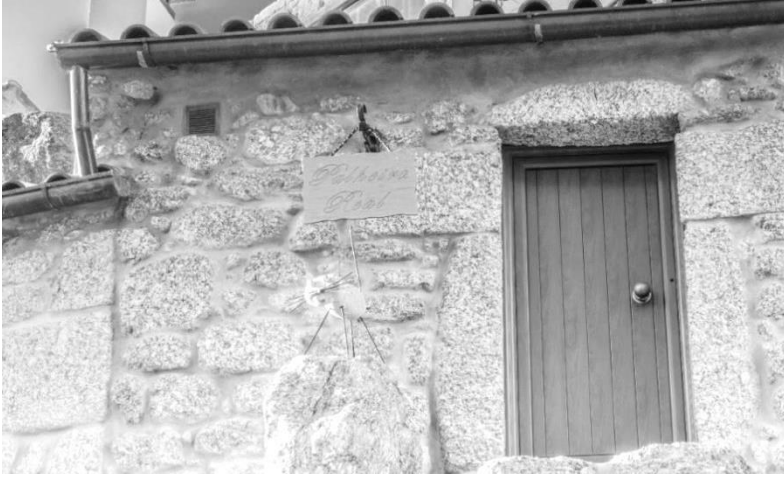
Figura 20 – O Lapinhas, na Rua da Lapa.

Quem, no Largo D. Dinis, optou por seguir para a direita, pôde apreciar as ruas estreitas que saem do Terreiro da Neta e uma paisagem fascinante, diferente de todas as outras, que se pode apreciar da Eirinha em direção aos terrenos verdejantes da Cal, da Mestra ou mesmo do Junqueiro e das Vinhas. Seguindo as ruas estreitas que existem ali naquelas imediações, é possível encontrar algumas casas antigas, numa linha muito diferente das que se encontram na Rua da Lapa. É outra forma de beleza. Circundando atrás das casas do Largo D. Dinis e completando o círculo, volta-se ao mesmo lugar.