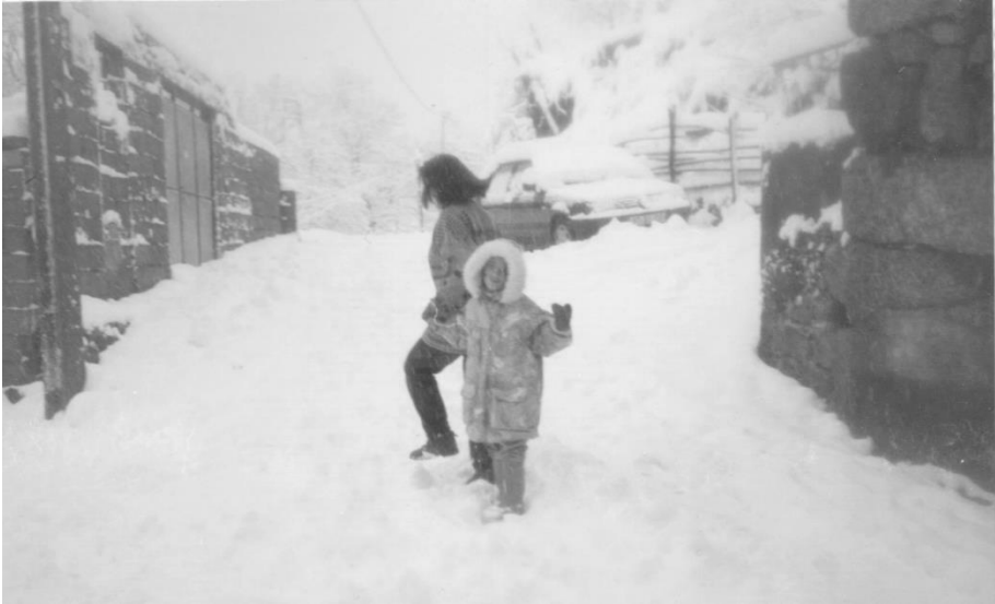
Figura 13 – Aspeto da Rua dos Vereadores, no Outeiro, num nevão em 1992.

gueiras nos terrenos de cultivo para queimar folhagem e os ramos velhos. O fumo branco e leve, cheirando a ramos verdes ardidos, sobe em colunas que ondulam e se desfazem nas alturas, largando um perfume de saudade, só comparável ao estaladiço cheirinho das castanhas quentes, acabadas de assar.