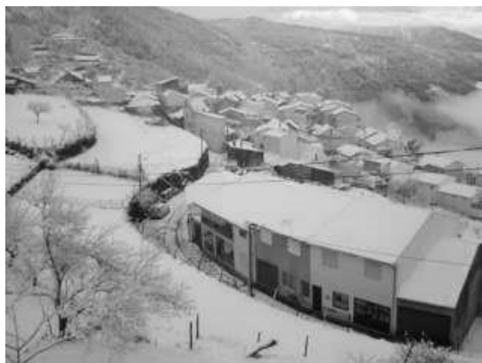
Figura 4 – Nevão sobre a Tapada Barroca.

É pena que tanta gente tenha tido necessidade de partir! Se regressassem à terra todos os lapenses que vivem em Portugal (já não conto os que saíram do país), aqueles que, tendo nascido na Lapa dos Dinheiros, atualmente vivem noutra ponta deste país com as suas famílias, a aldeia encher-se-ia de novo de animação e vida, como antigamente, havendo até um grande número de crianças para alegrar o ambiente, para manter a escola aberta e para dar de novo vida às ruas agora desertas e silenciosas.