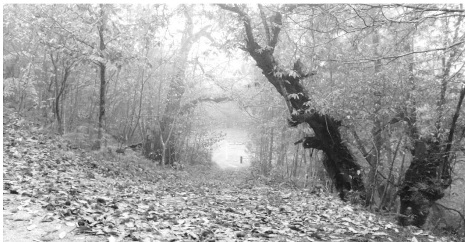
Figura 10 – Outono nos soitos que circundam o campo de futebol.

voada desde muito cedo. Sabe-se que os vestígios encontrados no Buraco da Moura revelam, pela simplicidade e natureza do espólio descoberto, que quem por ali passou não era gente de grandes posses. No entanto, sabe-se das lendas que há tesouros enterrados, espalhados por aqueles terrenos que circundam as grutas. Consta-se até, que há quem já tenha encontrado alguns no século XX, mas não há certezas disso. Não sendo uma aldeia de tamanho grande, prima pela existência de belíssimas paisagens naturais, bem como pela possibilidade que nos dá de apreciar os vastíssimos horizontes, alcançados quando olhamos ao longe, em qualquer ponto da aldeia.