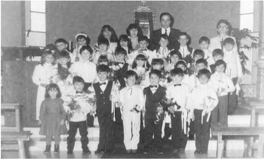
Figura 2 – Grupo de catequese do início da década de 80 do século XX.

A aldeia da Lapa dos Dinheiros é uma das muitas que existem, espalhadas pelas encostas da Serra da Estrela. Fica situada na Beira Alta, pertence ao distrito da Guarda e ao concelho de Seia e integra, atualmente, a União de Freguesias de Seia, São Romão e Lapa dos Dinheiros, cujo primeiro e atual presidente é Paulo Pina, um senense com metade do seu coração na aldeia de Lapa dos Dinheiros por ter casado com uma jovem nascida na Lapa. É uma localidade muito pequena e cada vez menos povoada. As pessoas, que outrora enchiam as suas ruas, foram saindo para outros lugares e hoje a população residente é de aproximadamente 300 habitantes, cerca de metade das pessoas que havia em 1970 1 .