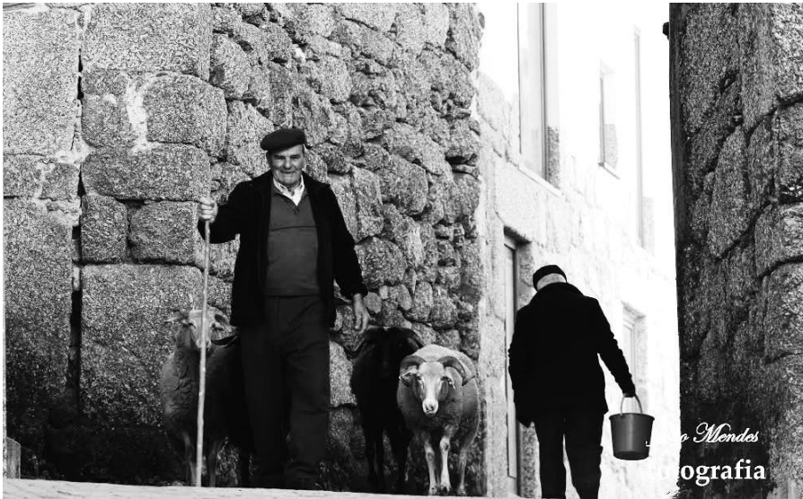
Figura 8 – Um pastor e as suas ovelhas, na Lapa dos Dinheiros.

deu nome a um povo que já existia, é bem possível que a Lapa tenha uma História mais antiga do que aquilo que imaginamos.