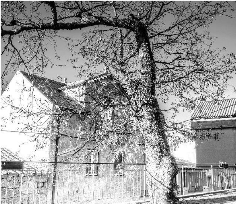
Figura 6 – Carvalha muito antiga, no adro da Capela da Nossa Senhora do Amparo.

atualidade. Depois de concluírem os cursos, esses jovens não voltaram e alguns também saíram do país em virtude de Portugal não oferecer saídas de emprego nas suas áreas.