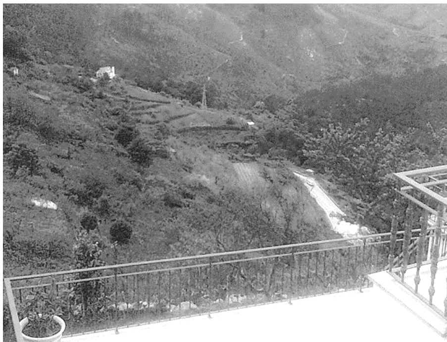
Figura 16 – Socalcos cultivados, vistos de uma varanda do Bairro das Malhadas.

É o momento de começar a subir em direção à aldeia.