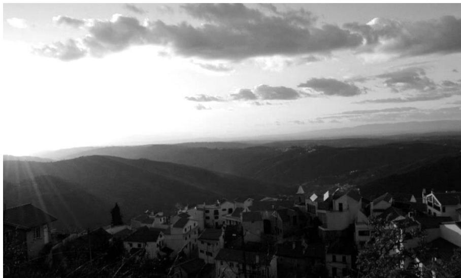
Figura 3 – Pôr-do-Sol sobre a parte antiga da Lapa dos Dinheiros.

É pena que tanta gente tenha tido necessidade de partir! Se regressassem à terra todos os lapenses que vivem em Portugal (já não conto os que saíram do país), aqueles que, tendo nascido na Lapa dos Dinheiros, atualmente vivem noutra ponta deste país com as suas famílias, a aldeia encher-se-ia de novo de animação e vida, como antigamente, havendo até um grande número de crianças para alegrar o ambiente, para manter a escola aberta e para dar de novo vida às ruas agora desertas e silenciosas.