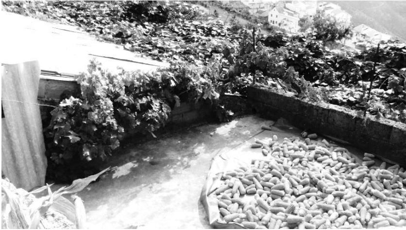
Figura 12 – Videiras com uvas maduras e espigas de milho a secar, no verão.

tanheiros e carvalhos negrais e alvarinhos que, sendo árvores de folha caduca, emprestam aos poetas um sem número de inspirações belíssimas, ao trocar periodicamente as cores da sua roupagem.