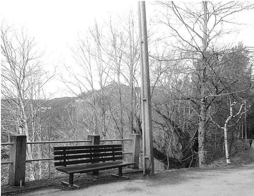
Figura 11 – Banco no caminho do soito, numa paisagem de inverno.

que nos deixa encantados com a forma como dispõe as palavras no seu poema “Outono”, trazendo-nos ao olhar a realidade de uma esplendorosa paisagem de vinha vindimada.