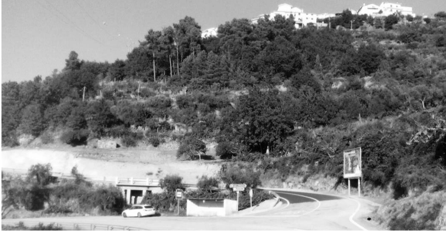
Figura 15 – Entrada para a Lapa dos Dinheiros, no lugar a que se chama Ramal.

altura. Lembro-me do meu pai cavar um carreirinho 5 para se poder andar e mandar-nos ir para dentro, quase sem experimentarmos a falsa maciez da neve branca. Foi o maior nevão de que me lembro.