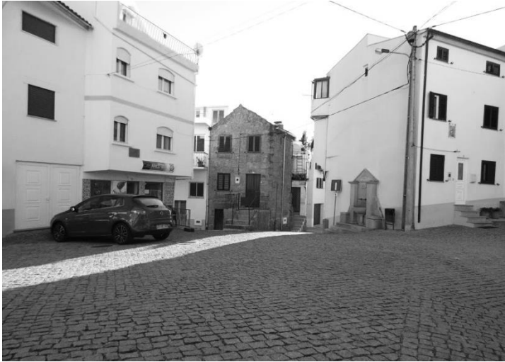
Figura 17 – Largo D. Dinis.

goso de ribeira, possível de atravessar em dias de menor caudal, serpenteando no contorno das encostas onde banha os terrenos de cultivo dos Mieiros e do Chão do Pardo, das Cilhas e dos Pisões 6 .