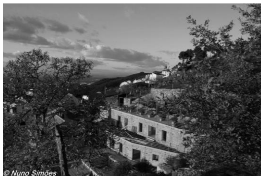
Figura 9 – Proximidade da Lapa dos Dinheiros com o Céu.

Sabemos, pelas escavações feitas no Buraco da Moura, que a Serra da Estrela, tem vestígios de existência de população nesta zona desde pelo menos a Idade do Ferro e do Bronze e isso aponta para uma data anterior a quatro mil anos.