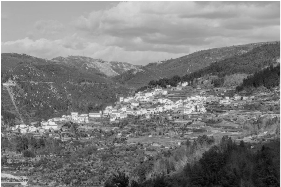
Figura 1 – Vista global da aldeia, do lado de Valezim.

L APA DOS DINHEIROS é a aldeia onde eu nasci. Ali fui crescendo e ali deixei as minhas memórias mais belas, aquelas que me trazem mais saudade e me causam mais nostalgia. É uma aldeia cuja História nunca ninguém escreveu. Ouvem-se contar passagens interessantes ou engraçadas e existem lendas explicativas daquilo que não se sabe explicar, mas pouco mais há, de concreto, para poder traçar as linhas históricas desta pequena aldeia. Não sou eu que vou fazê-lo. Atrevo-me apenas a partilhar convosco algumas das minhas memórias e das memórias das pessoas mais idosas, com quem eu conversava quando vivia na Lapa dos Dinheiros, e decerto muitas das histórias que ouvi seriam reais ou pelo menos continham muitos factos verídicos. A partir daqui, talvez alguém se atreva a melhorar para escrever História. Ficarei bastante satisfeita se isso acontecer.