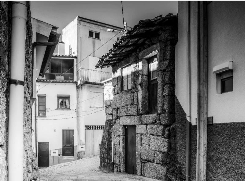
Figura 18 – Casa pequenina desabitada.

dessa pequenez, mas também do tipo de casas graníticas que se mantêm por ali e da paisagem natural que as envolve. Descobrem-se ainda as várias casas de pedra, restauradas com muita beleza, mantendo a fachada original, algumas delas tão pequeninas que se assemelham à casa dos sete anões da história tradicional infantil da Branca de Neve.